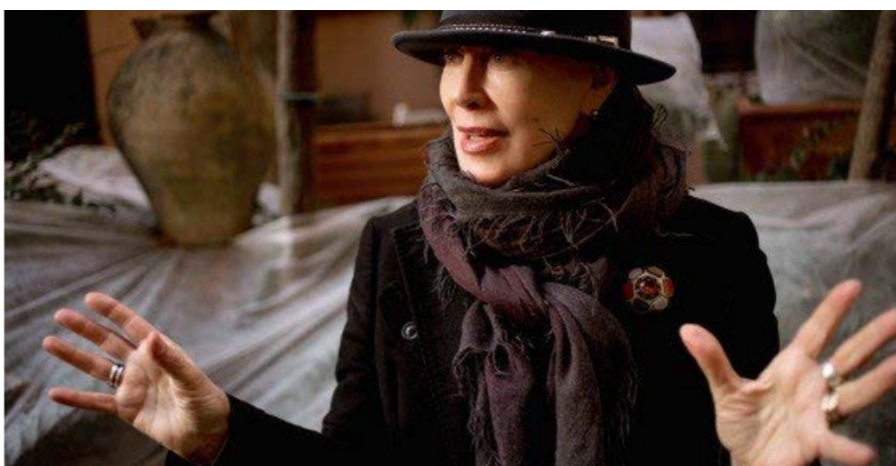
جشنواره فلم برلین امسال جایزه خرس طلای افتخاری خود را به یک طراح لباس ایتالیایی اعطاء می کند. به نقل از سایت رسمی جشنواره برلین، «ملینا کانوترو»

طرح لباس ایتالیایی به عنوان دریافت کننده جایزه خرس طلای افتخاری به پاس یک عمر دستاورد سینمایی معرفی شد. وی یکی از مطرح ترین طراحان لباس در جهان است.